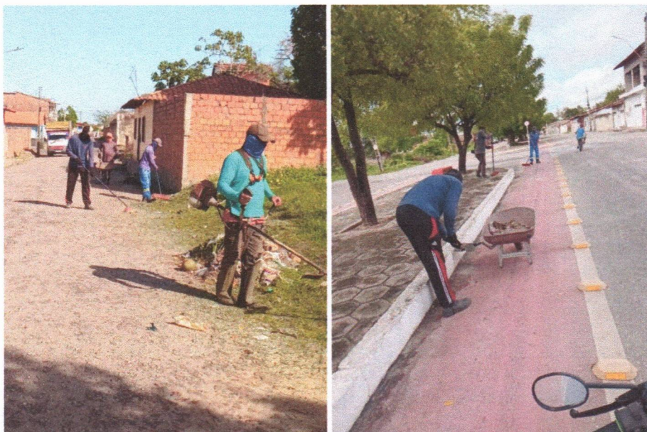
Imagem 06 – equipe realizando limpeza de ruas (varrição e remoção de entulhos), limpeza manual de vegetação em vias públicas e bota fora.