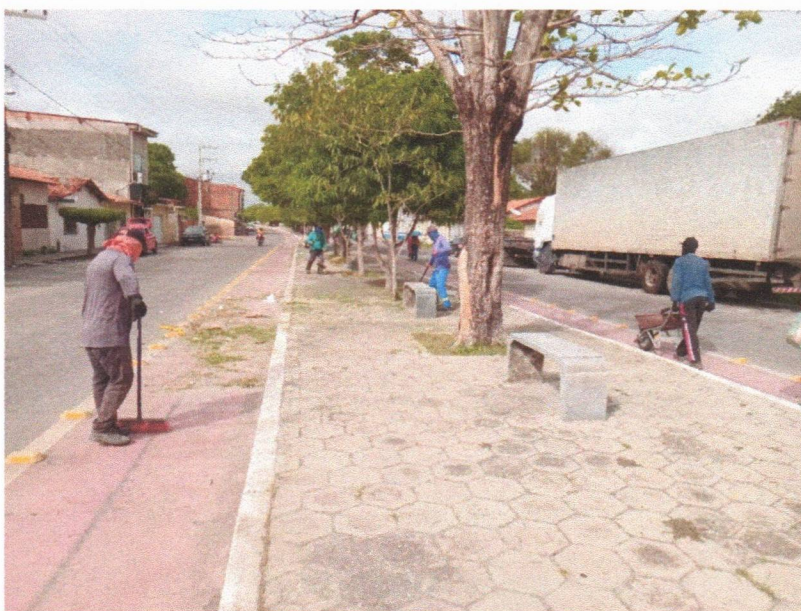
Imagem 07 – equipe realizando limpeza de ruas (varrição e remoção de entulhos), limpeza manual de vegetação em vias públicas e bota fora.