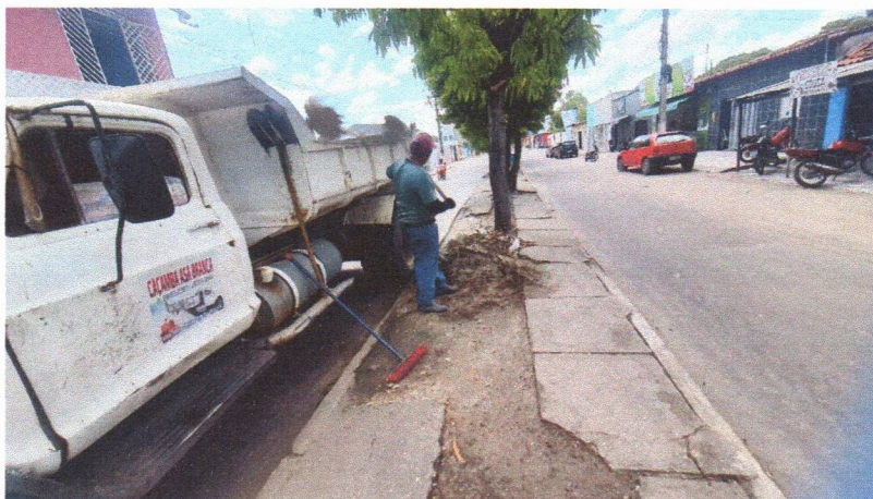
Imagem 01 – equipe realizando limpeza de ruas (varrição e remoção de entulhos), limpeza manual de vegetação com roçadeira em vias públicas e bota fora em caminhão basculante