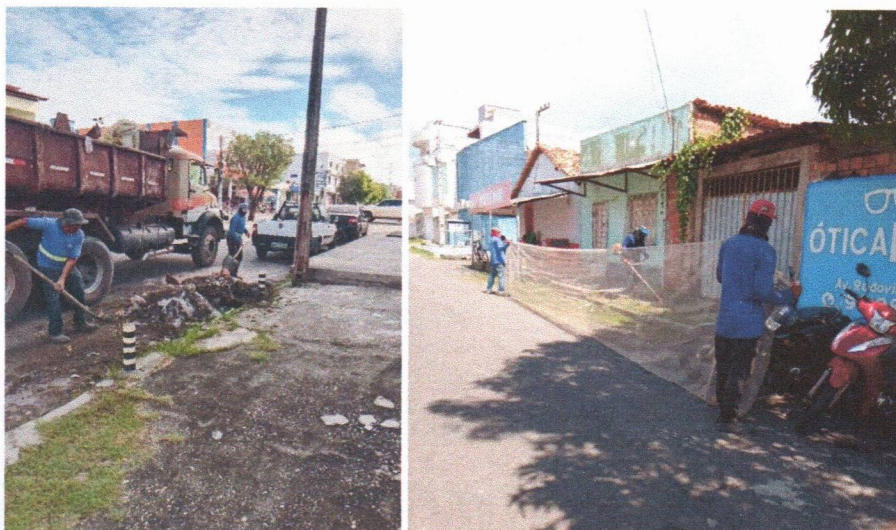
Imagem 05 – equipe realizando limpeza de ruas (varrição e remoção de entulhos), limpeza manual de vegetação em vias públicas e bota fora.