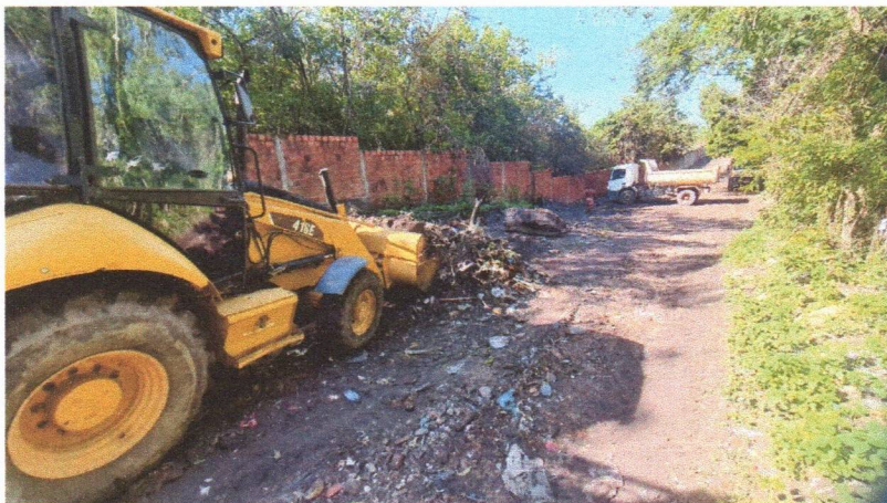
Imagem 03 – equipe realizando limpeza de ruas (varrição e remoção de entulhos), limpeza mecânica com roçadeira em vegetação em vias públicas.