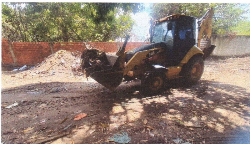
Imagem 02 – equipe realizando limpeza de ruas (varrição e remoção de entulhos), limpeza manual de vegetação com roçadeira em vias públicas e bota fora em caminhão basculante