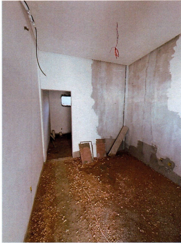
Imagem 5 – Execução do forro, emassamentos e preparação da base do granilite;