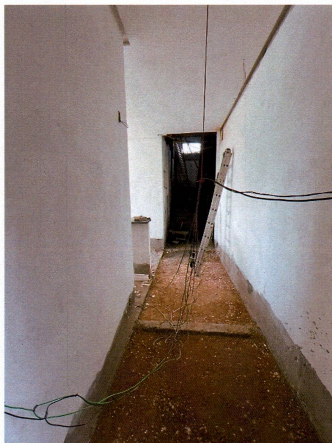
Imagem 10 – Execução do forro, emassamentos e preparação da base do granilite;

A handwritten signature in blue ink, consisting of a stylized, cursive letter 'S' followed by a dot.