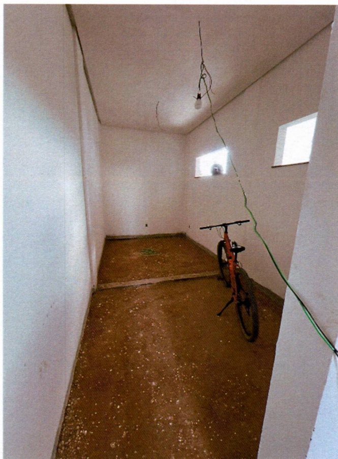
Imagem 9 – Execução do forro, emassamentos e preparação da base do granilite;