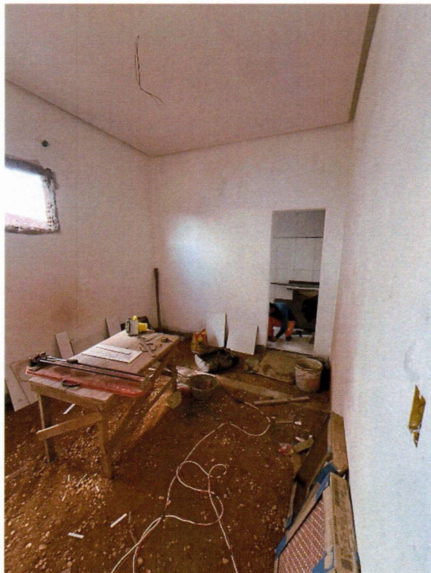
Imagem 6 – Execução do forro, emassamentos e preparação da base do granilite;

A handwritten signature in blue ink, consisting of a stylized, cursive letter 'S' followed by a flourish.