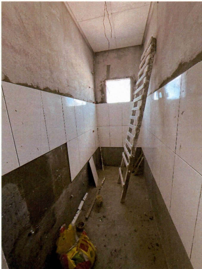
Imagem 18 – Execução dos revestimentos cerâmicos;