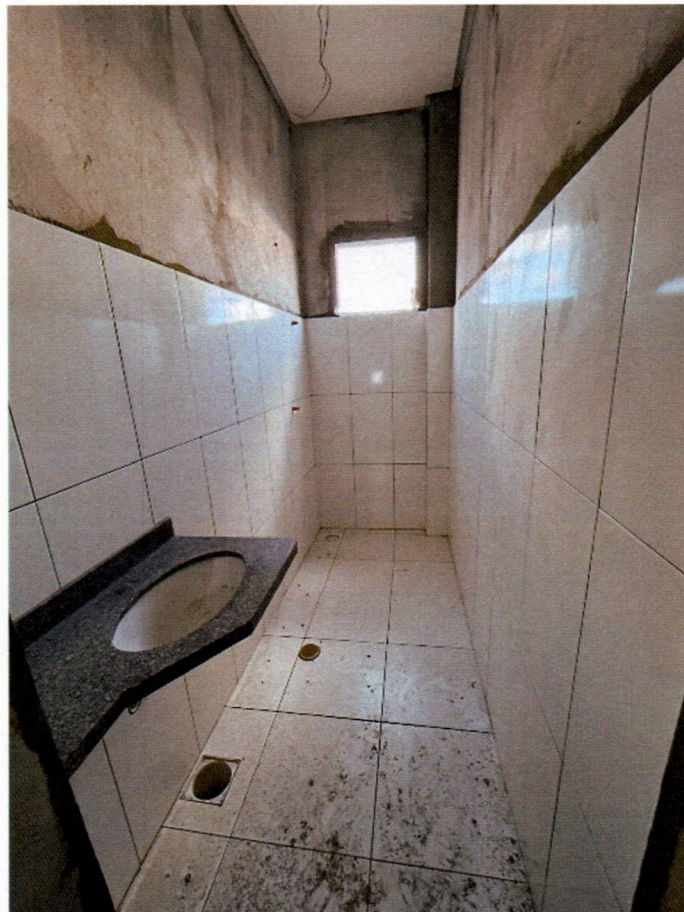
Imagem 14 – Execução dos revestimentos cerâmicos e pia de granito;