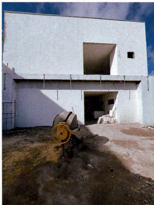
Imagem 1 – Início da montagem do ACM e execução de pinturas/texturas da fachada;

Relatório fotográfico para 6ª medição realizada "in loco" da Construção da Secretaria de Infraestrutura, no município Chapadina - MA, 65500-000.