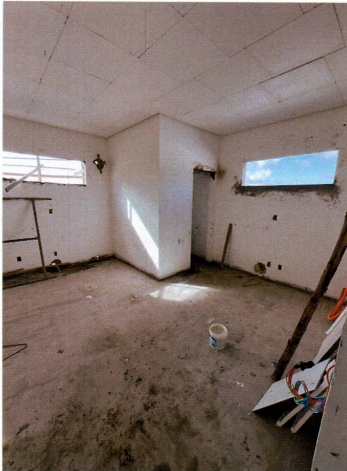
Imagem 17 – Execução de emassamentos, forros e contrapiso para porcelanato;