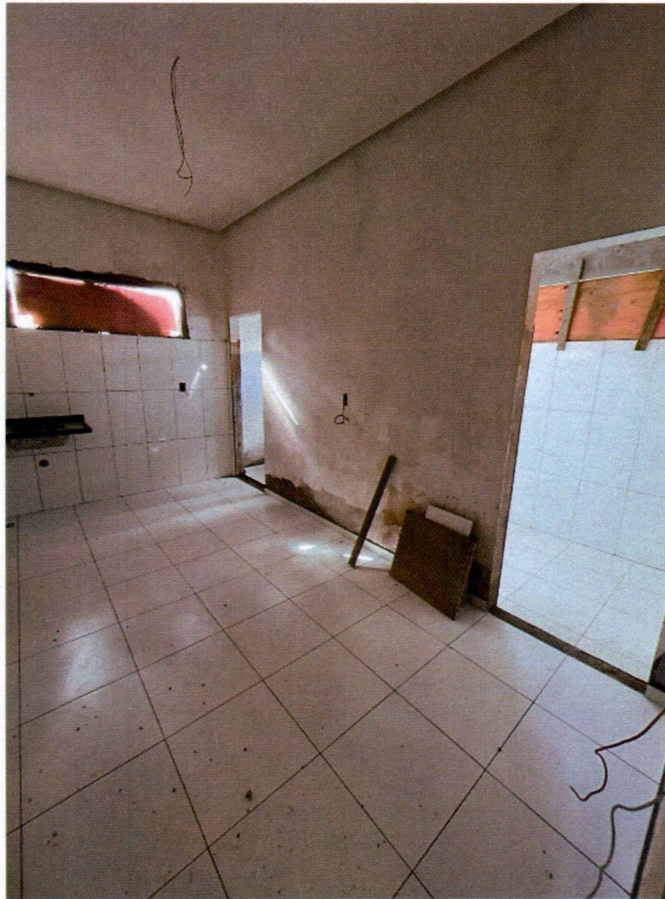
Imagem 13 – Execução dos revestimentos cerâmicos e pias de granito;